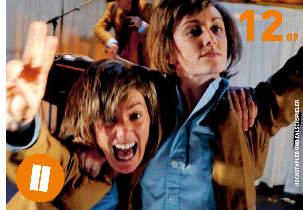
HOCHSTAPLER UND FALSCHSPIELER